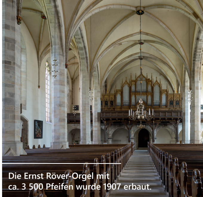
Die Ernst Röver-Orgel mit ca. 3 500 Pfeifen wurde 1907 erbaut.

Baugeschichte und Ausstattung der Kirche sind ein besonderer Schatz. Altarbilder aus der Werkstatt von Lucas Cranach dem Älteren (Ausschnitt siehe Titel oben) beeindrucken durch ihre Schönheit und ihrer Geschichte. Das Taufbecken von 1464 und die barocke Kanzel sind restauriert und erstrahlen im neuen Glanz.