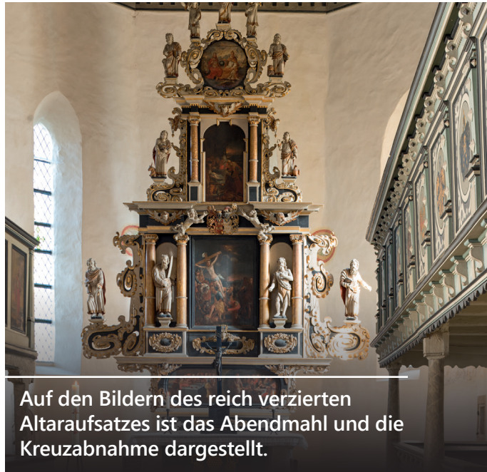
Auf den Bildern des reich verzierten Altaraufsatzes ist das Abendmahl und die Kreuzabnahme dargestellt.

Anschließend malte der Braunschweiger Maler Heinrich Busch die 92 Deckenbilder. Kernstück dieses Kunstwerks ist die Mittelreih. Sie erzählt die Heilsgeschichte von der Erschaffung des Menschen bis zum Jüngsten Gericht. (Titel: Maria und das Christkind im Stall) Die Kanzel wurde 1665–67 durch den Tischler Melchior Stellwagen aus Halle geschaffen. Sie zeigt Darstellungen der vier Evangelisten und Jesus als guten Hirten.