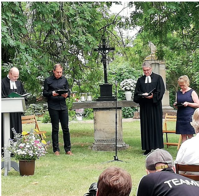
Erntebittgottesdienst auf der Kirchwiese 2020

Nach dem Krieg begann die Gemeinde mit der Erneuerung. Im Jahre 1664 fertigte der Tischler Hans Reiche aus Calbe die hölzerne Kassettendecke.